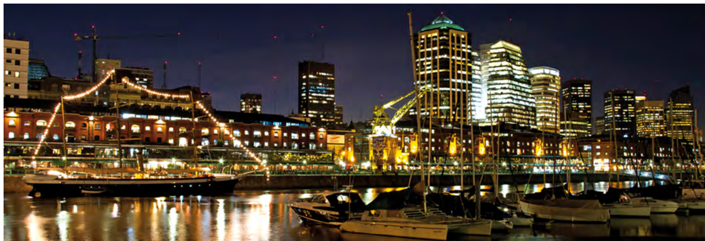
▲ Puerto Madero - Ciudad Autónoma de Buenos Aires - Argentina

At national level, the University is an active member of the International Cooperation Network of National Universities (Red CIUN), the Network of Buenos Aires Universities (RUNBO) and the Argentine Forum for International Education (FAEI) and National Universities Network for Internationalization and Regional Integration (Red UNIR).