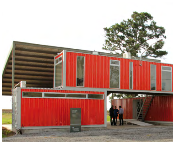
▲ Campo experimental UNNOBA - Junín - Buenos Aires - Argentina