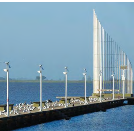
▲ Laguna de Junín - Junín - Buenos Aires - Argentina

▼ ...Es la cabecera del partido de Junín y se encuentra a orillas del río Salado. Por su relevancia en el contexto regional, se la conoce como "la perla del noroeste"