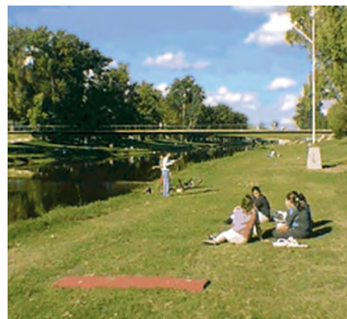
▲ Parque municipal - Pergamino - Buenos Aires - Argentina