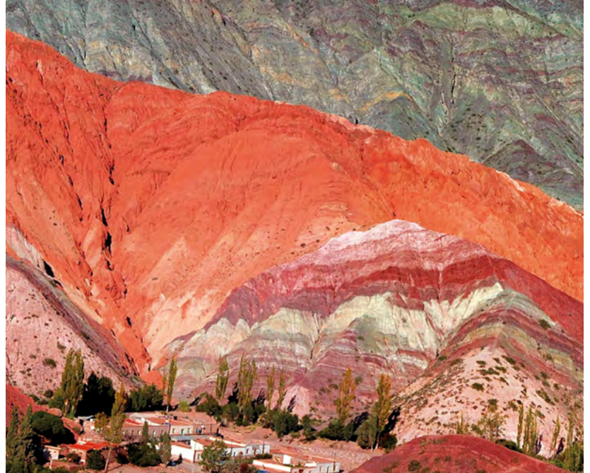
▲ Cerro de los Siete Colores, Purmamarca - Jujuy - Argentina