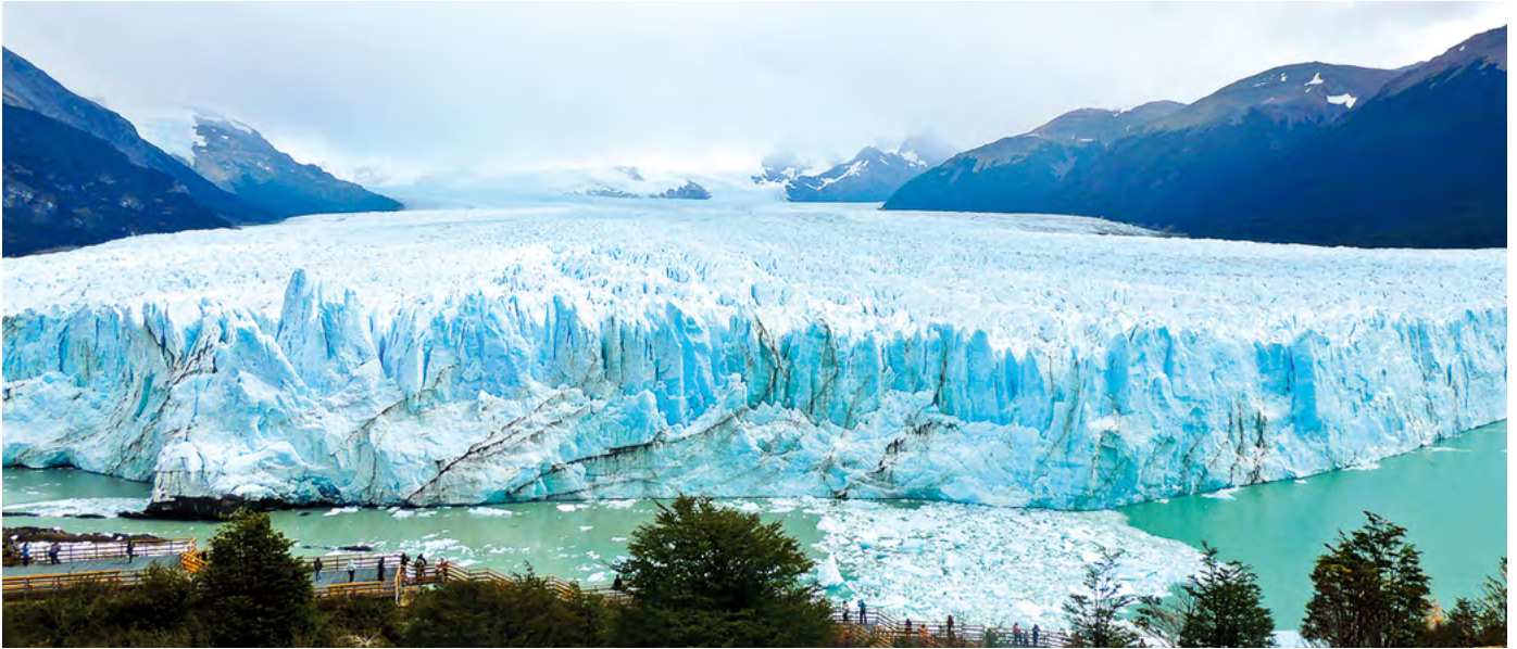
▲ Glaciar Perito Moreno, El Calafate - Santa Cruz - Argentina