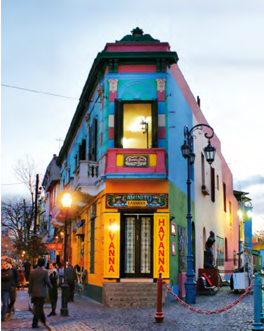
▲ Caminito, La Boca - Ciudad Autónoma de Buenos Aires - Argentina